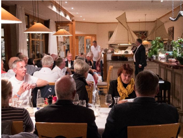
Galadinner beim Augsburger Segler-Club