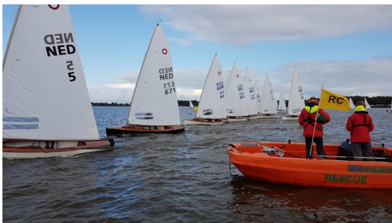
Holländische Meisterschaft: Kurz nach dem Start