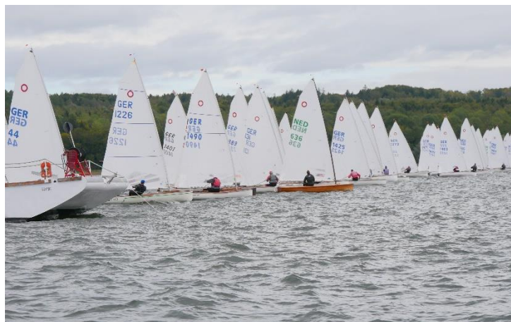
62 O-Jollen an der Startlinie

Ach ja, gesegelt wurde übrigens auch. Und zwar acht Rennen an drei Tagen bei schönem Wind, am Anfang mit Regen und am Ende mit Sonne. So viele Läufe hatten wir bei einer Deutschen Meisterschaft schon lange nicht mehr.